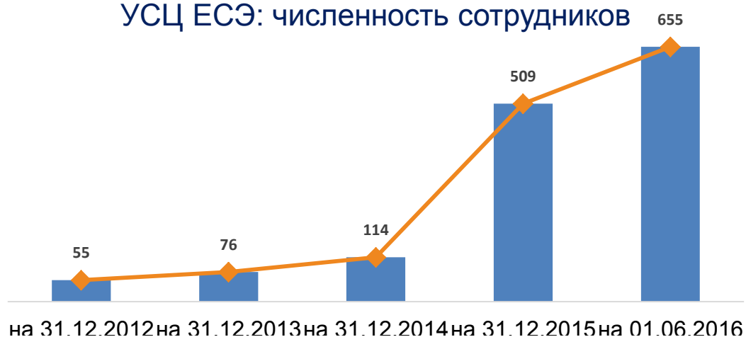
УСЦ ЕСЭ: численность сотрудников