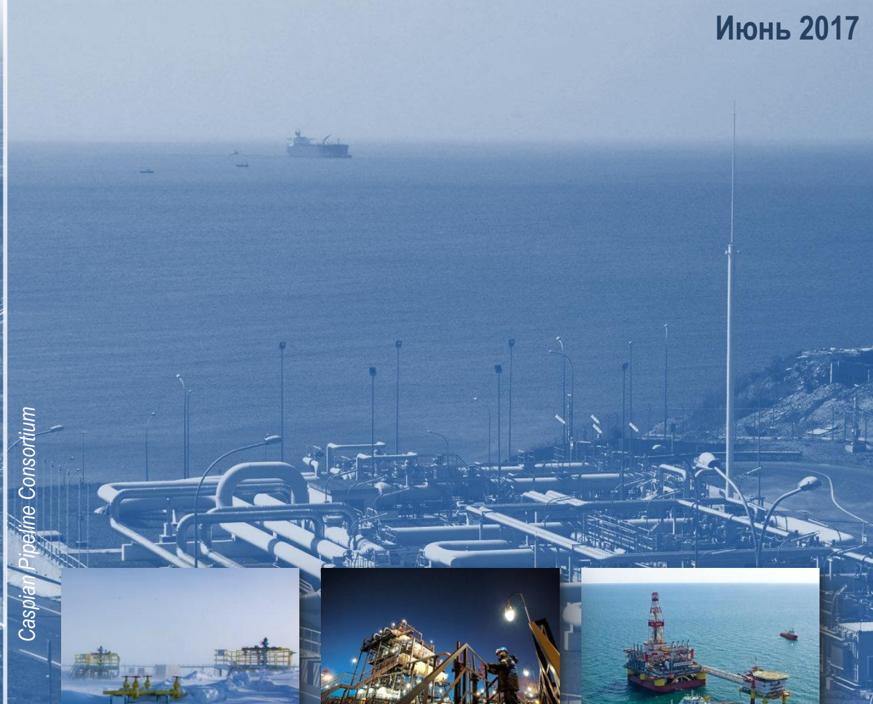
Caspian Pipeline Consortium